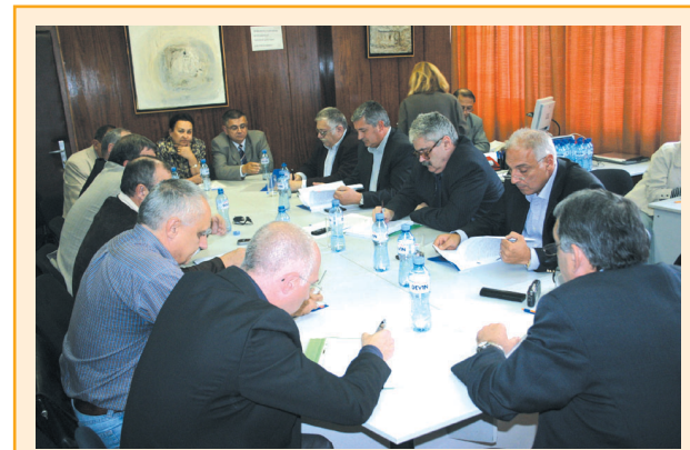
Създаден бе Съвет на болничните мениджъри към БЛС

помощ се създават медицински съвет; лечебно-контролна комисия; комисия по вътрешболнични инфекции и, ако е необходимо, комисии по медицинска етика, лекарствена политика, развитие на информационното осигуряване и др.