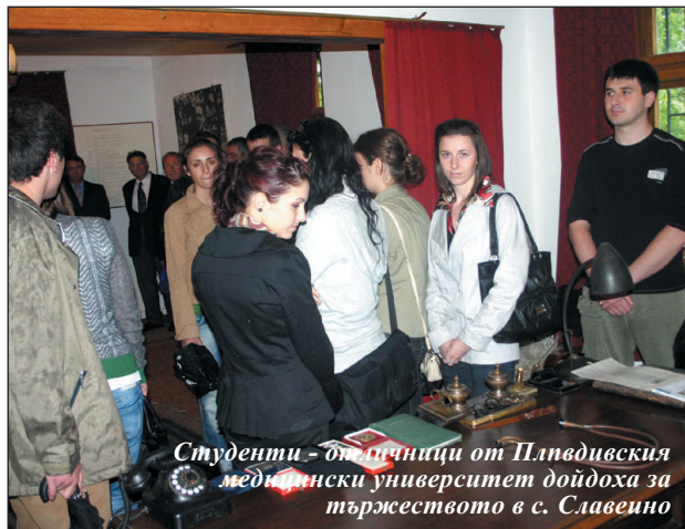
Студенти - участници от Пловдивския медицински университет дойдоха за тържеството в с. Славейно

че двама от най-изтъкнатите ни лекари, учени и пре-