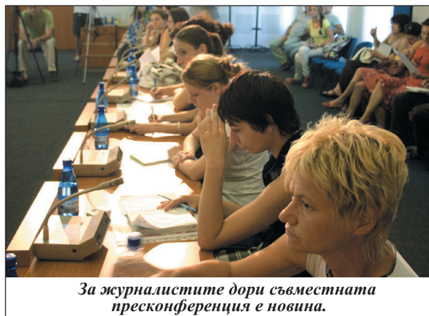
За журналистите дори съвместната пресконференция е новина.

имат диалог. Адърска посочи конкретни пресни примери за безгрижието на държавата към онкоболните - например възрастен паци-