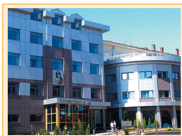
„Св. Екатерина“ е една от представителните и успешни болници в България

7. отчита своята дейност пред изпълнителния директор.