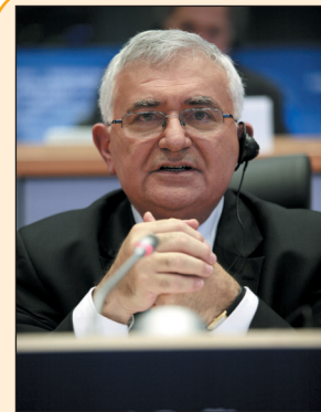
Джон Дали е роден през 1948 г. в Малта. Политическата му ка-

Запитан чия страна би заел при евентуален конфликт между фармацевтичната индустрия и потребителите, Дали категорично потвърждава отдадеността си на потребителите. Въпреки това той посочва, че наличието на силен фармацевтичен сектор ще е в полза на евро-