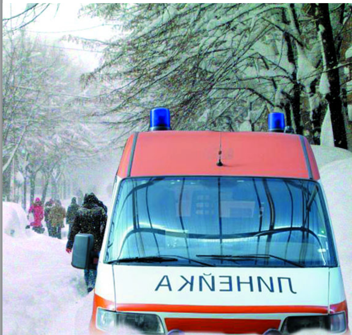
Минусови градуси при старта на болничната реформа...