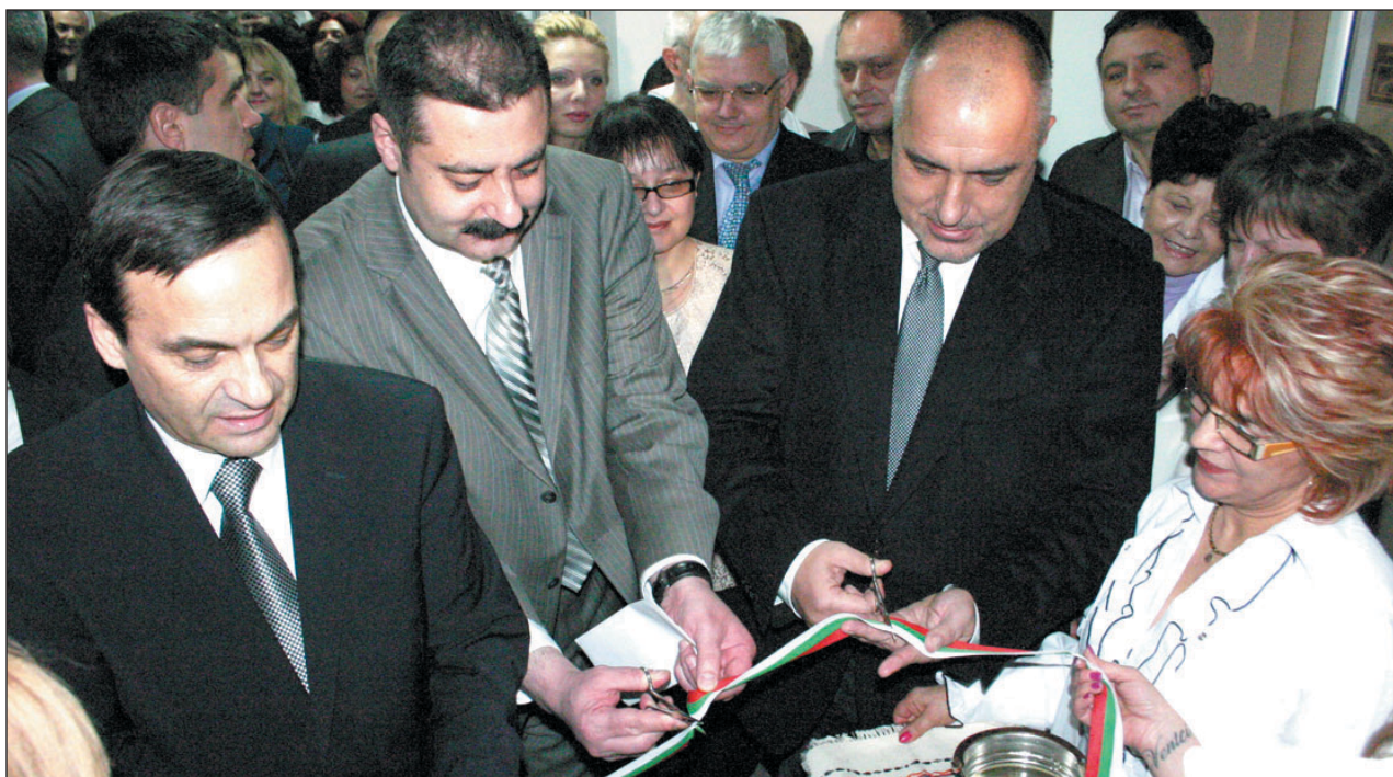
Премиерът Бойко Борисов и министър д-р Божидар Нанев откриват осъвремененото отделение.

агностични изследвания от рода на виртуална колоскопия и изследване на кръвотока (тъканната перфузия) в мозъка, черния и белия дроб, в другите вътрешни органи. С помощта на двата апарата ще бъде възможно бързо и в пълен обем определяне на стадия (стадиране) на онкологичните заболявания. Методите на изследване понастоящем са основните два за образната диагностика и ще повишат равнището на диагностичния процес при неврологични и неврохирургични заболявания. Двата апарата на опорно-двигателния апарат, на таза и на вътрешните органи, при процеси, развиващи се в медиастинума. Апаратурата ще обслужва хоспитализирани пациенти, пациенти със животозастрашаващи състояния, консултирани в Спешно отделение на болницата, пациенти с направление от НЗОК, както и здравно неосигурени пациенти, които ще заплащат по ценоразписа на УМ-