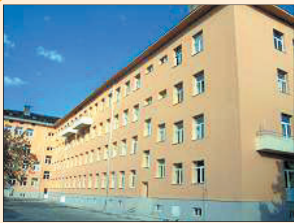
МБАЛ в Свиленград

No pain, no gain (Без болка няма успех).