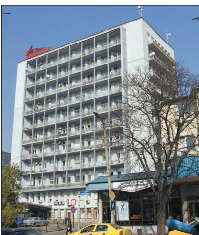
Арката на Александровска си остава символ на университетска болница (в средата). "Пирогов" и варненската "Света Марина" са победителите в конкурса "Най-иновативна болница".