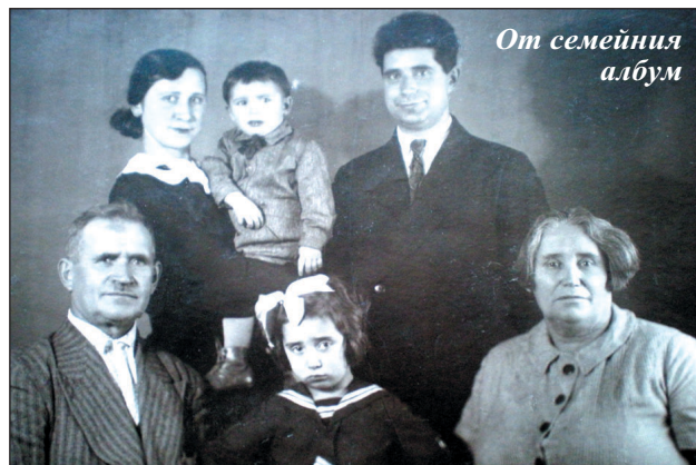
От семейния албум