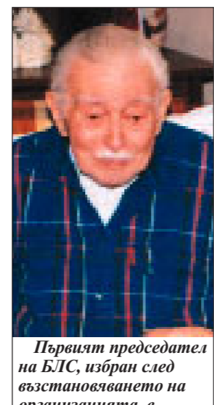
Първият председател на БЛС, избран след възстановяването на организацията, е проф. д-р Иван Киров.