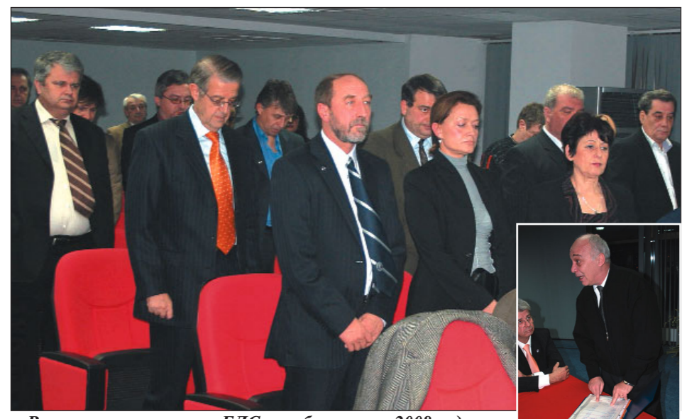
Възстановителите на БЛС се събраха през 2008 година на тържествено честване.